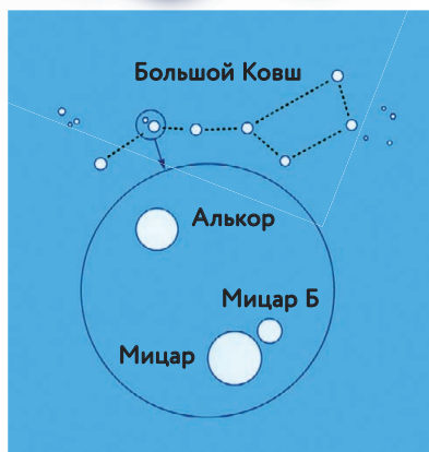
Двойные звёзды в Ковше Большой Медведицы

В обоих Ковшах видны две интересные двойные звезды. На изломе ручки Ковша Большой Медведицы расположился Мицар, и сопровождает его более тусклый Алькор, который также называют «маленький всадник». Обе звезды можно наблюдать невооружённым глазом. Они удалены от нас на 78 световых лет. Рядом с Мицаром есть ещё одна звезда — Мицар Б.