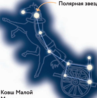
Ковш Малой Медведицы