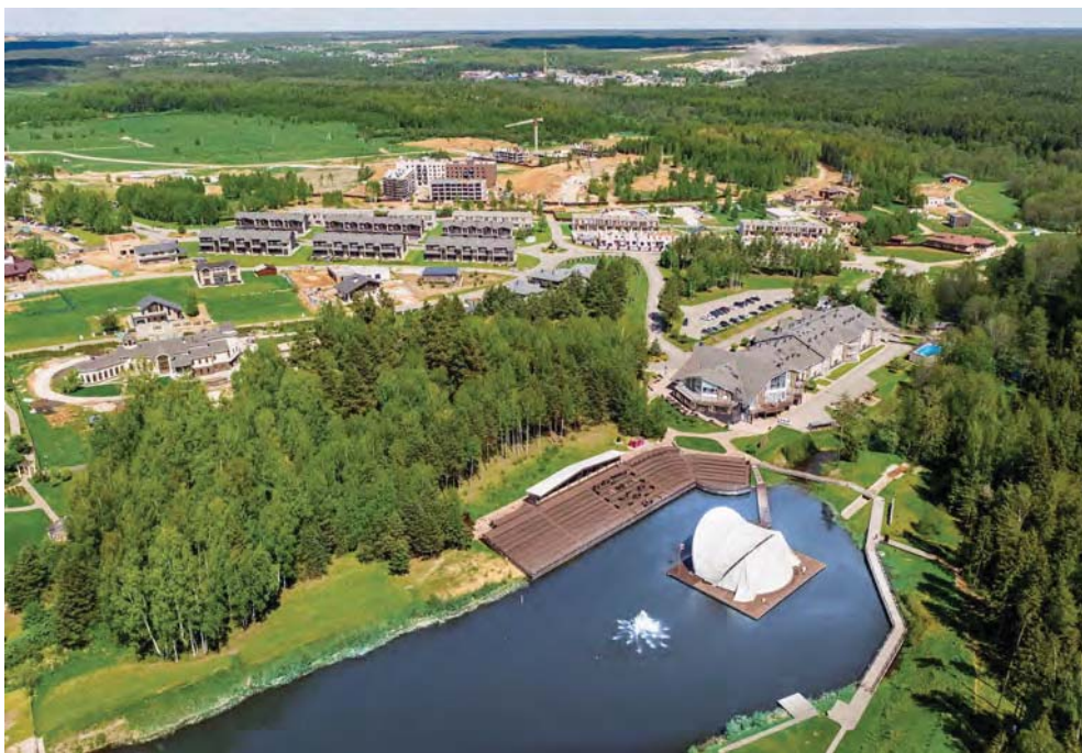
ВИД С ВЕРХУ НА УСАДЕБНУЮ ЧАСТЬ ДОБРОГРАДА

площадка готова к началу строительства предприятий резидентов. Для резидентов ОЭЗ «Доброград-1» тарифы на электроэнергию, водоснабжение, водоотведение и связь будут ниже региональных. В настоящее время статус резидента ОЭЗ «Доброград-1» получили 7 компаний, общий объем их инвестиций превышает 4,2 млрд рублей. Во второй половине текущего года мы ожидаем запуск производства первого резидента. Инвестиционный цикл компании – от получения статуса резидента до открытия нового предприятия – составит всего 8–10 месяцев! В ближайшие годы на территории ОЭЗ «Доброград-1» откроются производства медицинской, светотехнической продукции, инженерных комплектующих, машиностроения, агрокомплекс и другие. Главное требование к нашим будущим предприятиям – соблюдение всех экологических норм. Управляющая компания ОЭЗ «Доброград-1» помогает своим резидентам в решении административных вопросов, участвует в обсуждении всех законопроектов, которые могут способствовать повышению эффективности будущих предприятий и снижению финансовых издержек инвесторов. В ОЭЗ «Доброград-1» перед бизнесом открываются новые возможности!