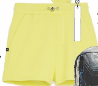
Шорты The Kooples