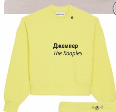
Джемпер The Kooples