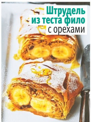
Штрудель из теста фило с орехами