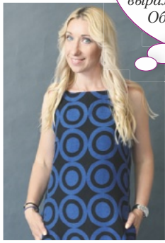
Главный редактор журнала «Лиза» и lisa.ru Алена Александрова

Зачем эти люди в общественных местах так странно одеваются, оголяются или «работают на публику»? уж слишком неординарно – это самовыражение или психотерапия? Об этом они рассказывают сами на с. 40.