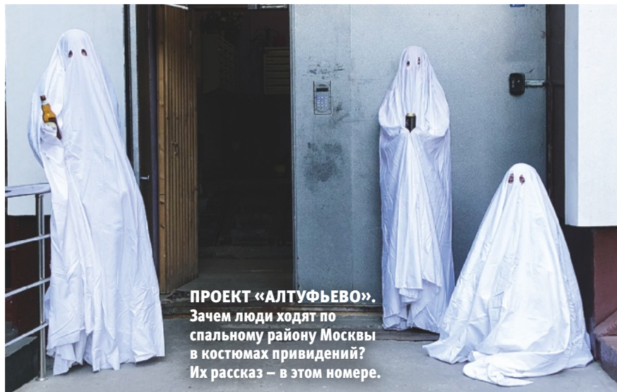
ПРОЕКТ «АЛТУФЬЕВО». Зачем люди ходят по спальному району Москвы в костюмах привидений? Их рассказ – в этом номере.