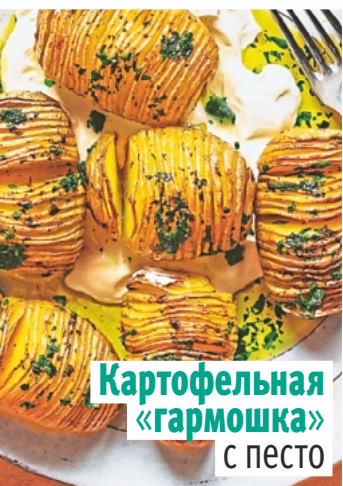
Картофельная «гармошка» с песто

слепых зон на лице и шее, за которыми многие забывают ухаживать