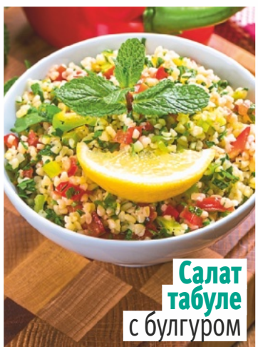
Салат табуле с булгуром

ОТПУСКАЕМ ТРЕВОГИ, СТРАХИ И ОБИДЫ... одним движением глаз (супертехника от психолога)