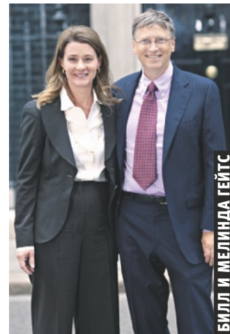
БИЛЛ И МЕЛИНДА ГЕЙТС

«ДОРОГАЯ» ЗДЕСЬ НЕ ОБРАЩЕНИЕ, А КОНСТАТАЦИЯ ФАКТА: основатель Microsoft, один из богатейших людей мира Билл Гейтс в результате расставания с супругой Мелиндой рискует лишиться внушительной части своего состояния. Их развод уже окрестили самым громким со времен бракоразводного процесса главы Amazon Джеффа Безоса и его жены Маккензи в 2019-м. Билл и Мелинда были в браке 27 лет, вырастили троих детей. О решении развестись они сообщили в Twitter 3 мая, резко увеличив спрос на попкорн.