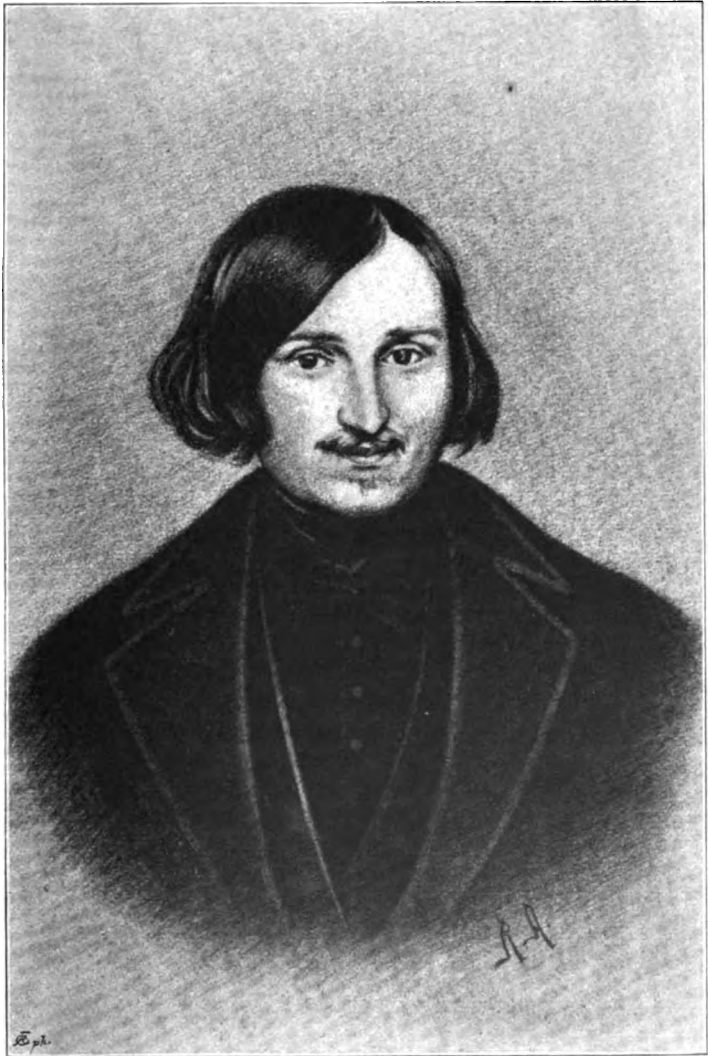
Николай Васильевичъ ГОГОЛЬ.