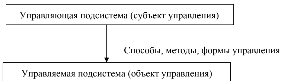
Рис. 3. Подсистемы финансового механизма корпорации

Управляющая подсистема (субъект управления) представлена финансовой службой предприятия и ее подразделениями.